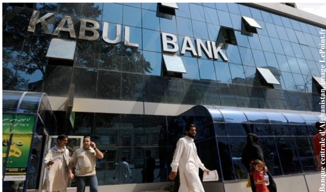
Banque centrale d'Afghanistan