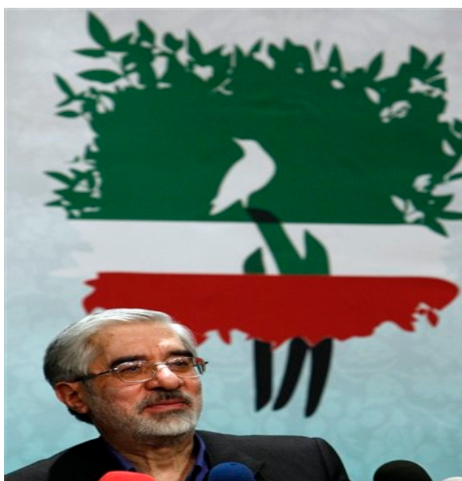
Mir Hossein Moussavi

Pour commencer, il est important de souligner que l'opposition issue de la rue est le conglomérat de nombreux profils. On y trouve des anti-régimes, des réformateurs, l'expression des vœux divers et variés de la diaspora mais aussi de revendications sociales et économiques. En effet, les prix des biens et de l'alimentation se sont envolés 3 , conduisant nombre de travailleurs à cumuler les emplois.